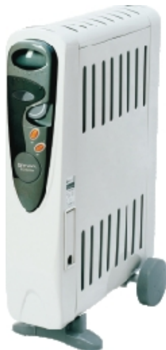
TOR 41... FH