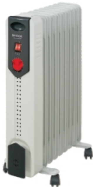
TOR 21... AC